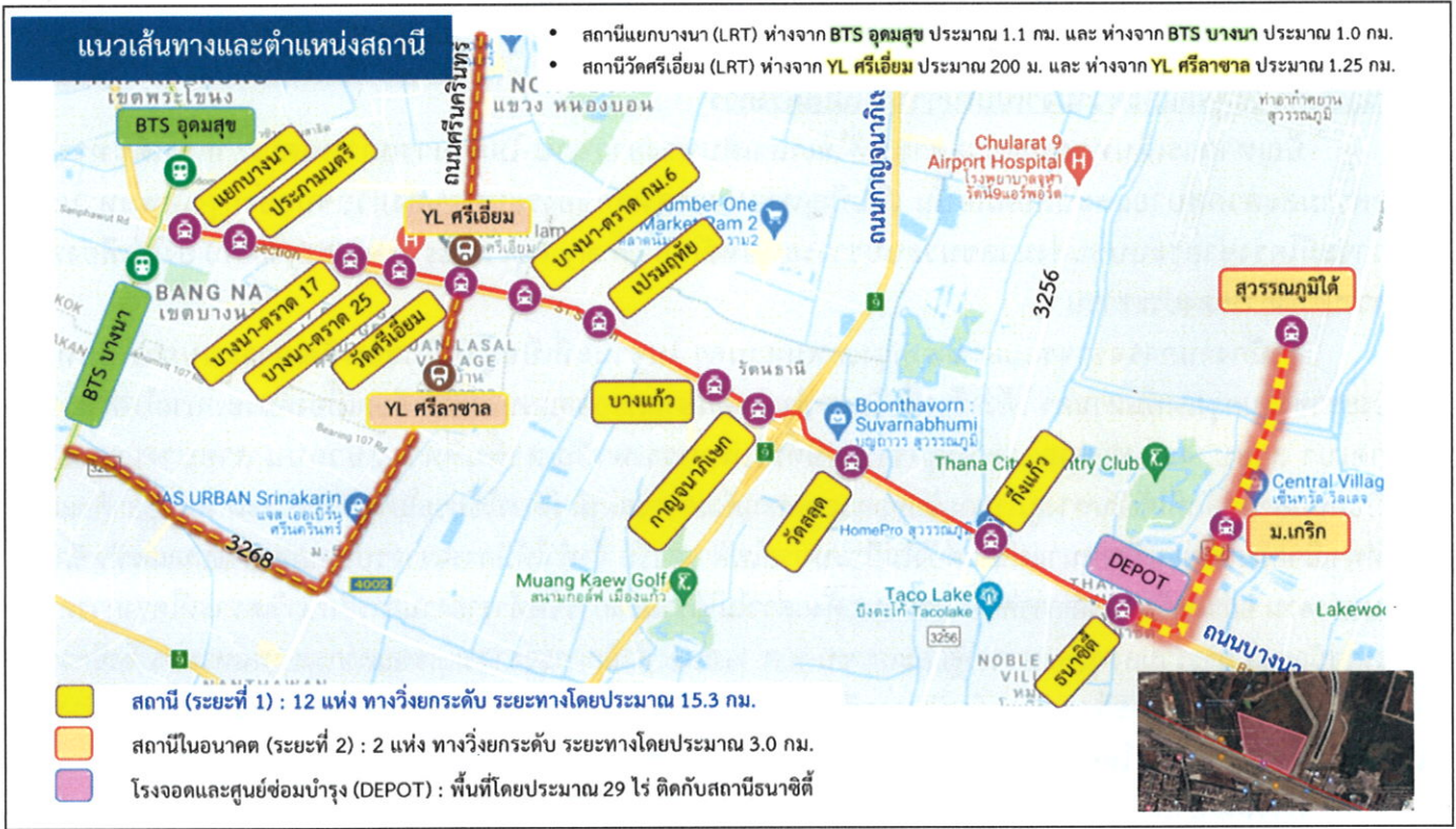
แนวเส้นทางและตำแหน่งสถานี