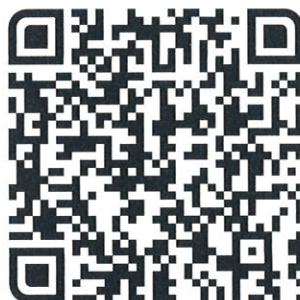
QR Code ดาวน์โหลดเอกสาร สื่อประชาสัมพันธ์