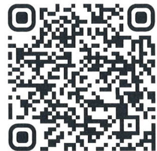
QR Code Zoom Cloud Meetings