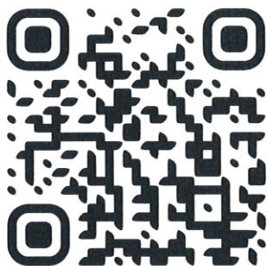
QR Code ลงทะเบียน Online

*กำหนดการอาจมีการเปลี่ยนแปลงได้ตามความเหมาะสม