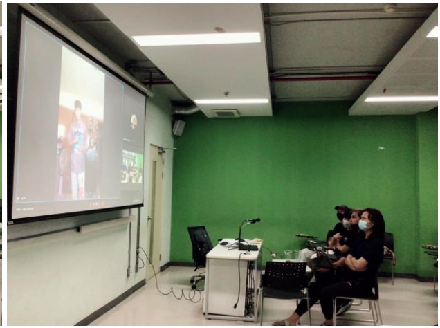
การคัดเลือกผู้สมัครออนไลน์