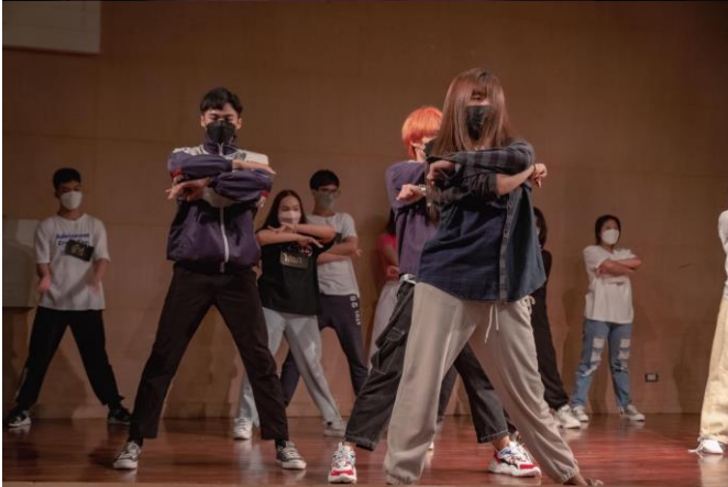
การอบรมการเต้นและการแสดง