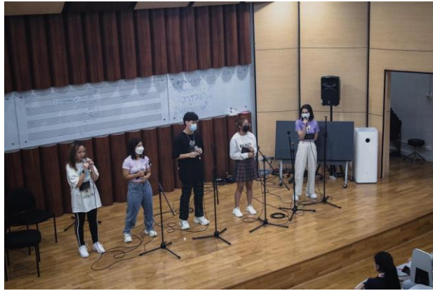
การอบรมด้านการร้องเพลง